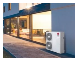
Pompa di Calore

Ti hanno inoltrato questa newsletter, ti è piaciuta e ora stai cercando il pulsante per iscriverti e ricevere anche le prossime? Eccolo qui